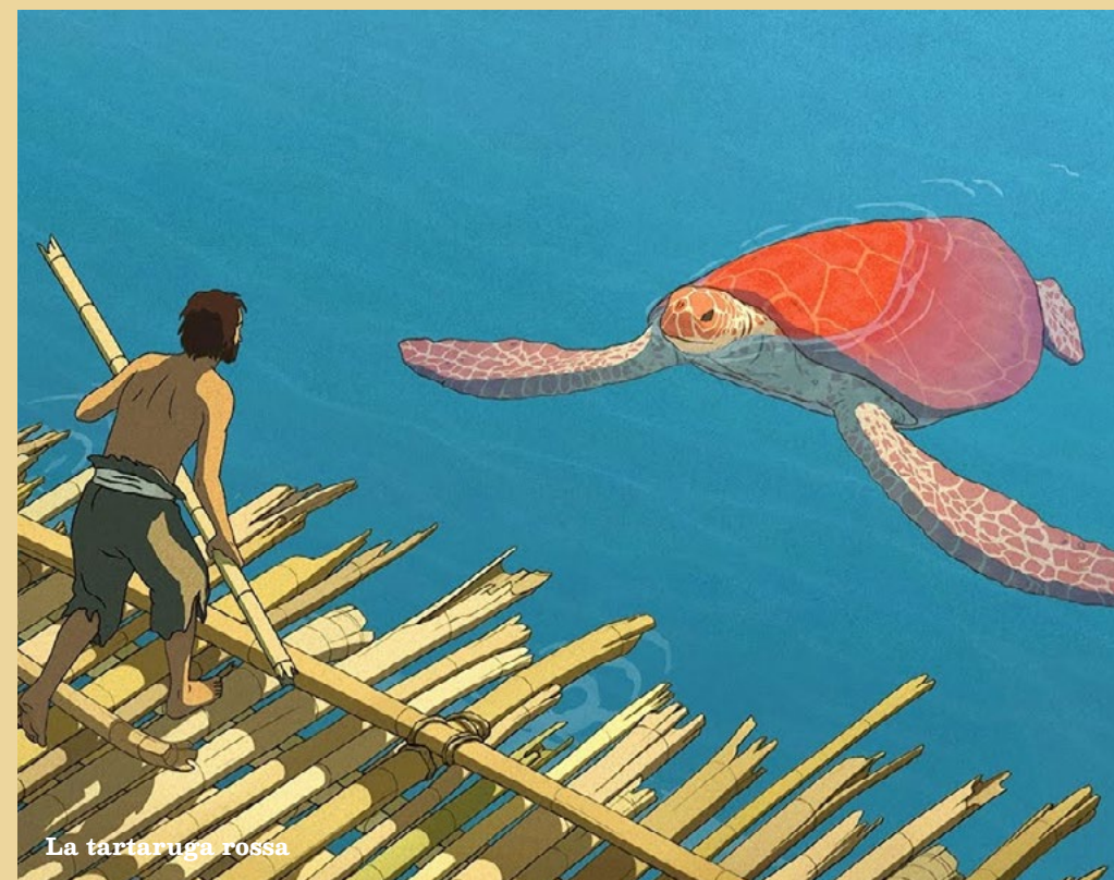
La tartaruga rossa

Questo menù di 7 film, pensato per bambini e famiglie in occasione di Mare Dire Fare 2021, consente di conoscere i mari e gli oceani attraverso le molteplici forme del cinema di animazione e la forza poetica del documentario!