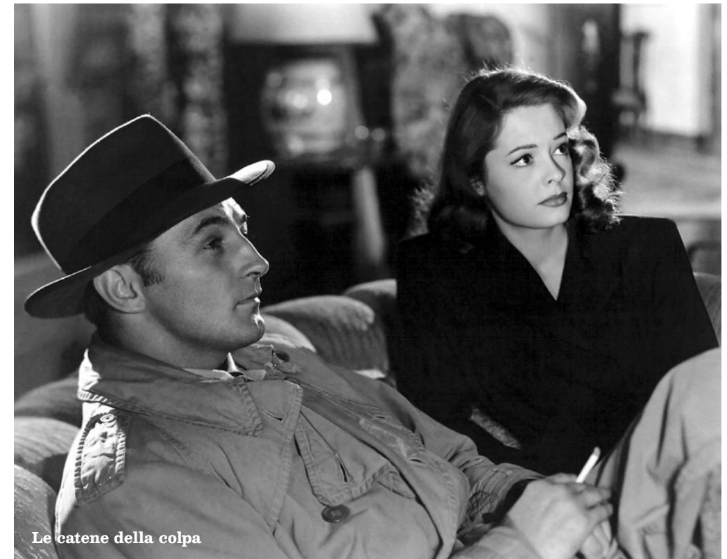
Le catene della colpa

Un uomo viene trovato ucciso e i testimoni hanno visto in volto l'omicida. C'è però un problema: l'assassina ha una gemella, e stabilire quale delle due sia la colpevole è praticamente impossibile.