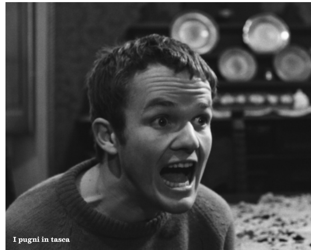
I pugni in tasca