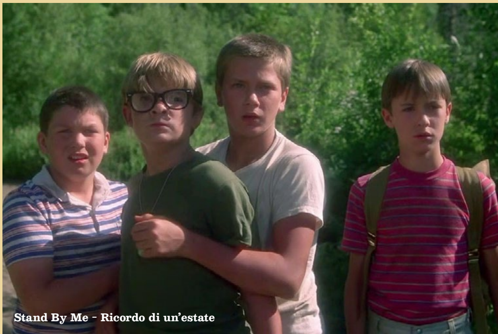
Stand By Me - Ricordo di un'estate

Con i suggerimenti di questa settimana dedicati ai ragazzi 14+, sette film in cui l'estate (in città e in periferia, di giorno e di notte) diventa il momento perfetto per raccontare una storia. Sette film capaci di riflettere sui molteplici significati di una stagione straordinaria.