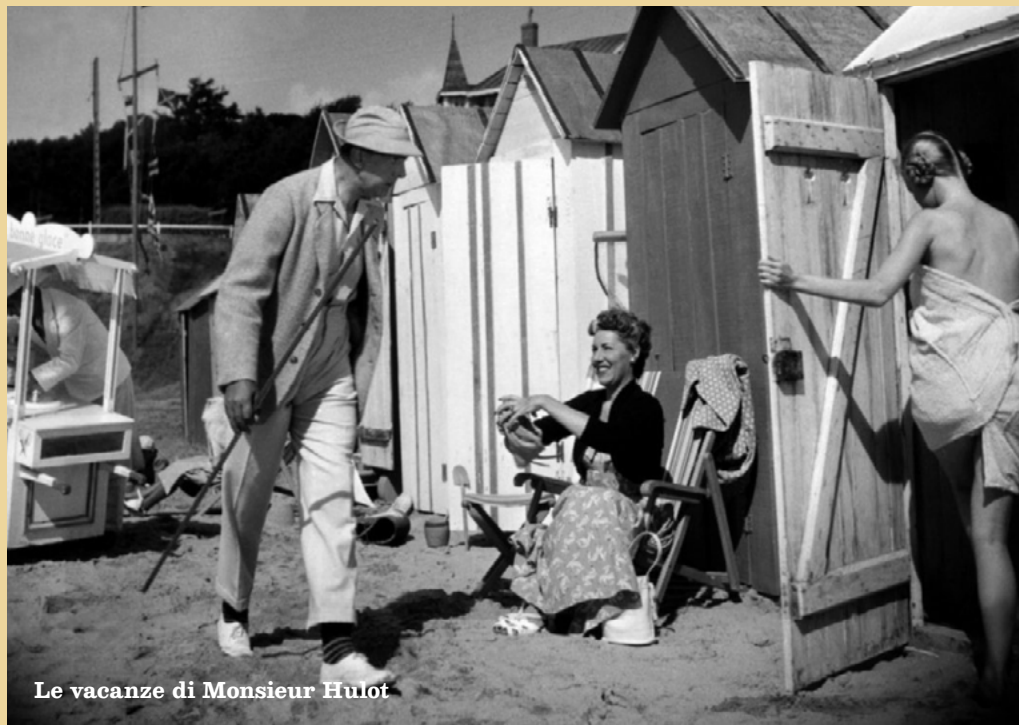
Le vacanze di Monsieur Hulot

E se d'improvviso... il sole si copre di nuvole, le gocce di pioggia cadono sul cono gelato, il mare s'increspa e il bagnino vi invita a lasciare la spiaggia? Semplice: venite in mediateca!