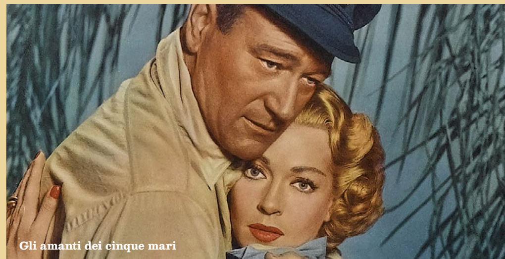
Gli amanti dei cinque mari

La potenza visiva dell'immane distesa d'acqua, un teatro per le passioni umane più disperate.