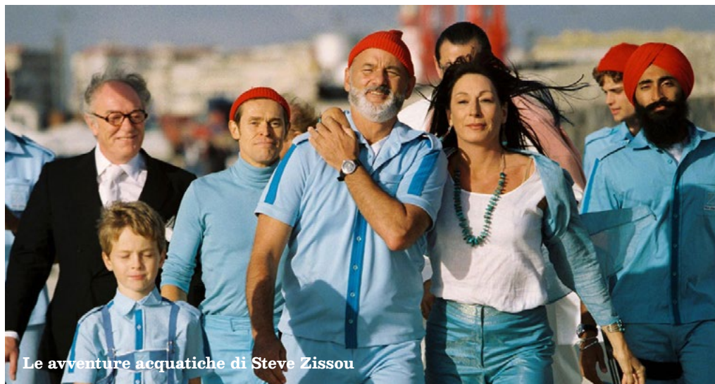
Le avventure acquatiche di Steve Zissou

Sull'isola di Lampedusa, due realtà completamente diverse convivono quotidianamente: da una parte il triste e desolante spettacolo dei migranti che arrivano stremati dalle loro terre d'origine; dall'altra l'umile vita di tutti i giorni di piccoli pescatori e lavoratori locali.