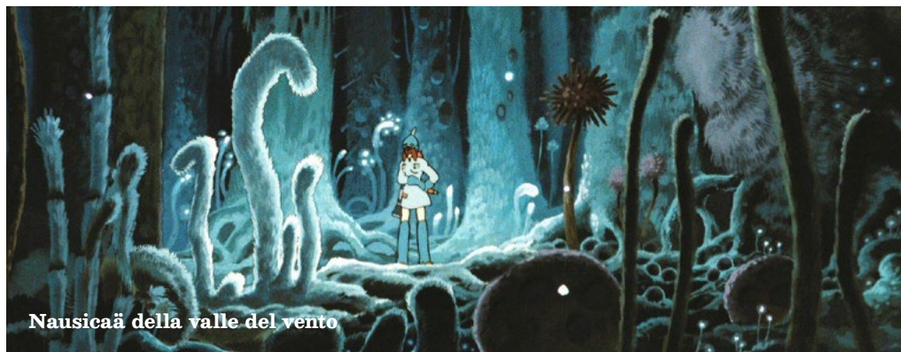
Nausicaä della valle del vento

Dopo una guerra nucleare, l'umanità si trova confinata in poche aree ristrette, tra cui la Valle del Vento, mentre sul resto del pianeta dilaga la Giungla Tossica, popolata da velenosi e mostruosi insetti.