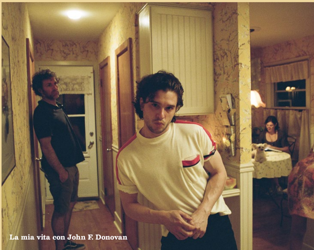
La mia vita con John F. Donovan

Siamo tornati! Durante la nostra assenza nuovi titoli sono diventati finalmente disponibili. Non resta che prenotare e prendere in prestito le nostre novità fresche di circolazione!