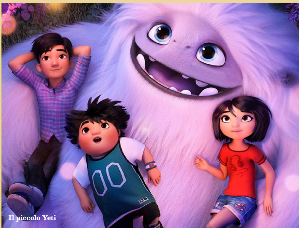
Il piccolo Yeti

Che sia la prima o l'ennesima volta che lo guardate, dovete star certi che vi daranno tutti la giusta carica per ricominciare... Ma a fare cosa?