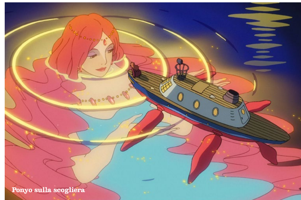
Ponyo sulla scogliera

Che cos'è il mare e quale grande storia si nasconde nelle sue profondità? Domande che nascono dalla vorace curiosità di un bambino di fronte all'immensità dell'oceano e da cui comincia un viaggio attraverso la storia dell'universo vista con gli occhi del mare e delle sue creature.