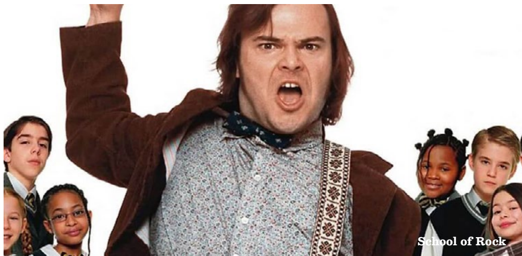
School of Rock

August "Auggie" Pullman, bambino affetto dalla Sindrome di Treacher Collins, si appresta a frequentare la quinta elementare in una scuola pubblica locale. È la prima volta che August si unisce a una classe di coetanei; tuttavia, nonostante le preoccupazioni di mamma Isabel e papà Nate, riuscirà a superare i pregiudizi dei compagni.